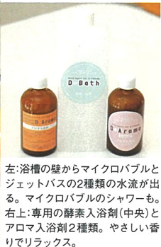
左:浴槽の壁からマイクロバブルとジェットバスの2種類の水流が出る。マイクロバブルのシャワーも。右上:専用の酵素入浴剤(中央)とアロマ入浴剤2種類。やさしい香りでリラックス。

たお店です。ゆったりとしたカフェスペースの奥にガラスで仕切られた小さなサロンスペースがあり、トリミング台とショウエイ社のウルトラソニックハイドロバス D-Friend が設置されています。おふたりが D-Friend を知ったきっかけは開業前、カフェの展示会へ足を運んだこと。「隣でスバの展示会もやっていて、帰りにたまたま寄ったら展示されていたんです」(坂井さん)。実はショウエイ社は、業務用ろ過装置の大手メーカー。同時に温泉施設の浴槽など「水」に関するプロデュースも手がけています。同社の技術をペット向けに応用して開発されたのが、マイクロバブルと超音波ジェットバスの機能を兼ね備えた D-Friend なのです。