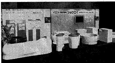
ショウエイブースのイメージ

今年のホテルズでショウエイは、安全、省エネ、快適をコンセプトとした浴槽の循環ろ過システム「Grenovation Technology」の紹介、展示販売を行う。また、温浴施設の設備を熟知したメーカーならではの新しい安全・省エネシステム「提案、相談も予定している。実機展示としては、自由にコーディネートできるFRPベースの、石と木のユニット式浴槽「悠湯」をはじめ同社の誇る各種商品を並べる。悠湯は工期と価格を大幅に圧縮できるのが特長だ。 「雄太」は、風呂で炭酸の爽快な刺激を体感できる人工炭酸泉製造装置だ。「炭酸の小イは、安全、省エネ、快適をさな気泡が体中で弾け、あの炭酸飲料を口に含んだ時の刺激が肌の上で起こると同社。浴槽内に取り付けられたノズルからマイクロバブル化（マイクロオキシド）した高濃度酸素を浴槽内に放出するマイクロナズル酸素泉製造装置の提案、相談も予定している。置が「湯白」。身体をやさしく包み込みながらしっかりと温める効果をもたらす。 96個のノズルによる多彩な「スーパーソニックトリートメント（癒しプログラム）」を楽しめるのが「ハイドロジェットバス「E-liss（アイリス）」だ。 また、トリートメントベッド「LaTeada（ラティダ）」は、効果の高い独特のリラクゼーションを提供。3種類のコースから好みのトリートメントを選べる。 犬用バス「D-Friend」は、マイクロバブルが犬の皮膚や被毛に付いた汚れを浮かび上がらせ、その汚れを「ウルトラソニック（超音波ジェット）」で取り除く。犬と泊まれる旅館・ホテルにはぜひ用意しておきたい。